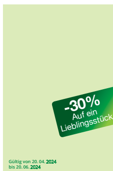
Vorderseite 61x 94 mm