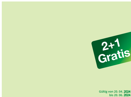
Vorderseite: 127 x 94 mm (B X H)