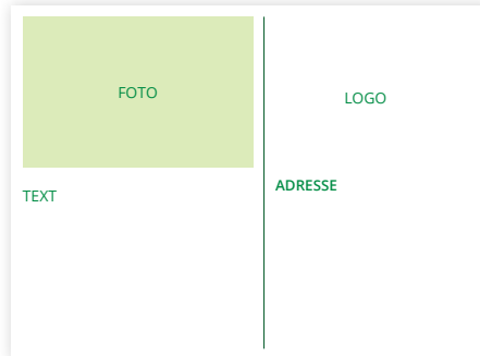
Rückseite: 127 x 94 mm (B x H)