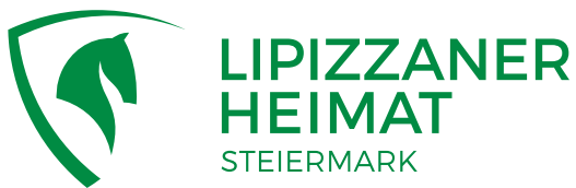
4C Version Grün

Bitte wenden Sie sich dafür an die LAG Lipizzanerheimat.