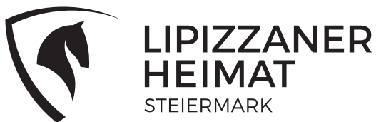
1C Version Schwarz